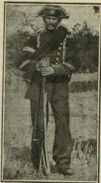
EL CABO ROMANO

Comandante del puesto de Setenil que persigue tenazmente á la partida del «Vivillo».