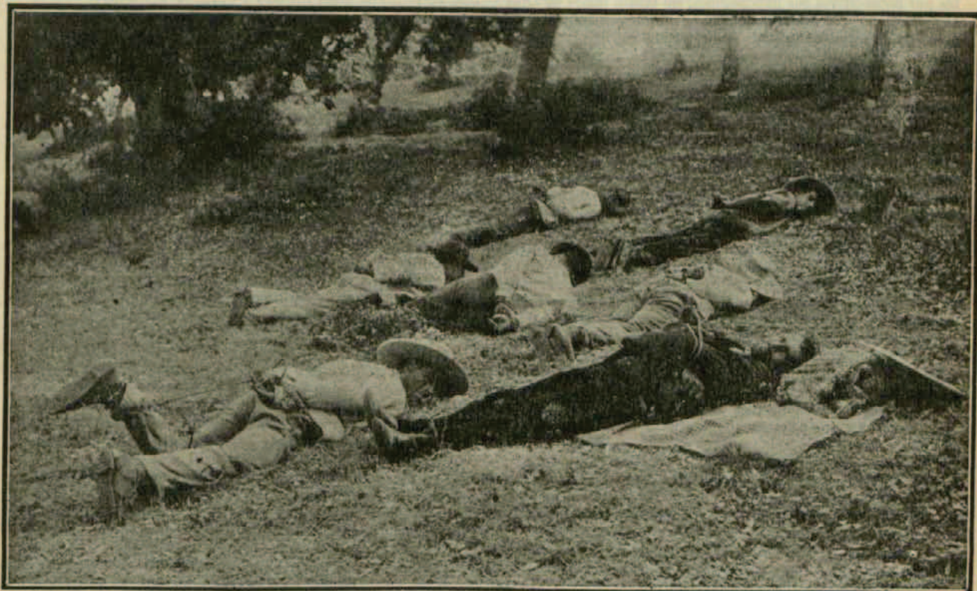
Forma en que el «Vivillo» y su partida ató á siete de sus víctimas en la Cañada del Boquerón. (Reconstitución hecha en el lugar del suceso.)