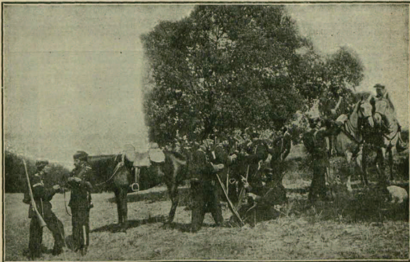
La Guardia civil del puesto de Setenil que persigue á los bandidos, descansando durante un reconocimiento en la Sierra.

— No, señor. Muy difícil. De poco ha de servir que marchemos en parejas atravesando campos y haciendo jornadas de cuarenta y ocho horas, durmiendo rara vez en un caserío: los que saben algo, callan, y los que hablan nos despistan.