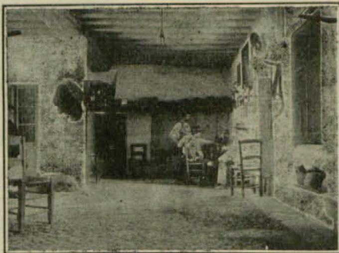
Habitación ocupada por el «Vivillo».

El que me había dado el alto me preguntó qué hacía por allí, dónde me dirigía, y en tanto que iba respondiendo á sus preguntas, que no formulaba en tono de amenaza, vi que algunos de los del grupo se incorporaban y