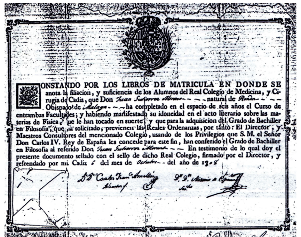
Figura 2 Diploma de Bachiller, Real Colegio de Medicina y Cirugía de Cádiz, 1808 (tomado de Bayarres, Montevideo 1992).

ambas Facultades” [medicina y cirugía en el Colegio de Cádiz] “y habiendo manifestado su idoneidad en el acto literario sobre las materias de Física que le han tocado en suerte” [medicina y cirugía] se le expidió certificado del “Grado de Bachiller en Filosofía”. Fue el grado inicial (Licenciado) que lo habilitaba para obtener el siguiente de Doctor (Profesor) en Medicina y Cirugía. De tal forma que en octubre de 1808 restaba cumplir los dos años de servicio embarcado si quería obtener ese título. Veremos que recién lo obtendrá en Buenos Aires. Pero todavía debió asumir un primer destino militar antes de su embarque, como consecuencia del estado de guerra entre el Reino de España y Francia.