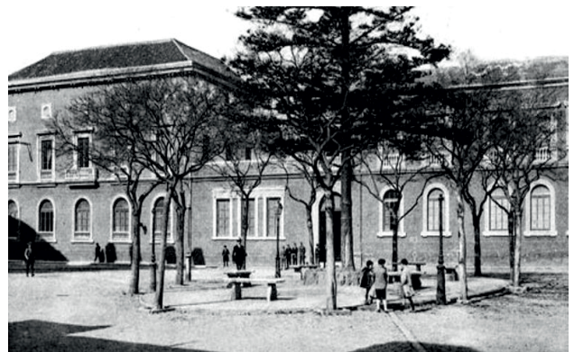
Figura 3 Real Colegio de Cirugía de Cádiz, Plaza Fragela, siglo XX.